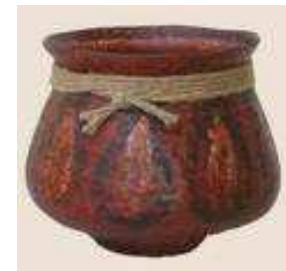
Vas Cultura Cucuteni

Ceramica din Cultura Cucuteni este cu atât mai valoroasă cu cât în Europa nu s-a mai găsit ceva asemănător. Finetea execuției și variațiile de forme fac mai grea alegerea unei similitudini între obiecte, însă o asemănare pregnantă s-a dovedit a fi doar între ceramică Cultura Cucuteni și ceramică chinezească aparținând unei culturi tot neolitice. Chiar dacă ambele se încadrează în