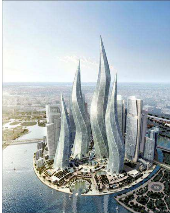
Hotel Sofitel (Tokio)