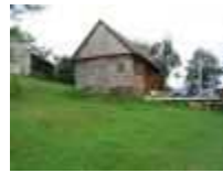
Așezare de moși