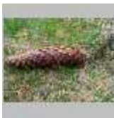
Con de brad din munții Apuseni

În munții Apuseni apar toate etajele și subetajele de vegetație. Vegetația subalpină se întâlnește insular în Curcubata mare și muntele Mare, limita ei inferioară coborând până la 1560 m. Asociațiile de tufărișuri apar în alternanță cu pajiștile alpine. Tufărișurile sunt formate din jneapăn, ienupăr pitic, arin de munte, smardar. Gramineele alcătuiesc în special pajiștile: părusca, iarba vântului, firuța și mai multe dicotiledonate.