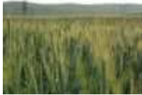
Lan de cereale