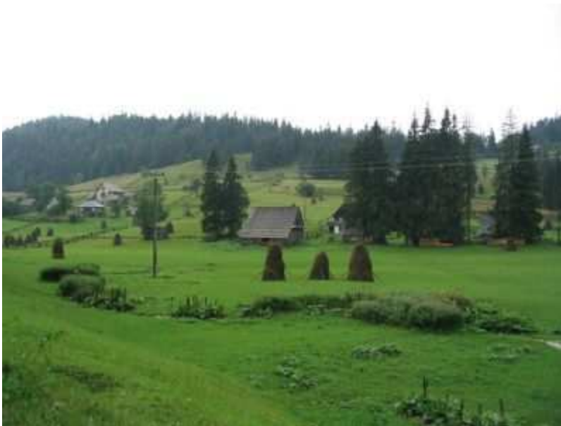
SATUL IN MUNȚII APUSENI

10. Manifestari folclorice dintre care prezinta interes datinile si obiceiurile traditionale ce se tin la date calendaristice fixe, anuale, saptamanale, sau cu diferite alte ocazii, mai cunoscute fiind cele de pe Muntele Gaina (iulie), Poiana Calineasa (14 iulie), Poiana Negrileasa si Salciua de Jos, Lupsa si Campeni;