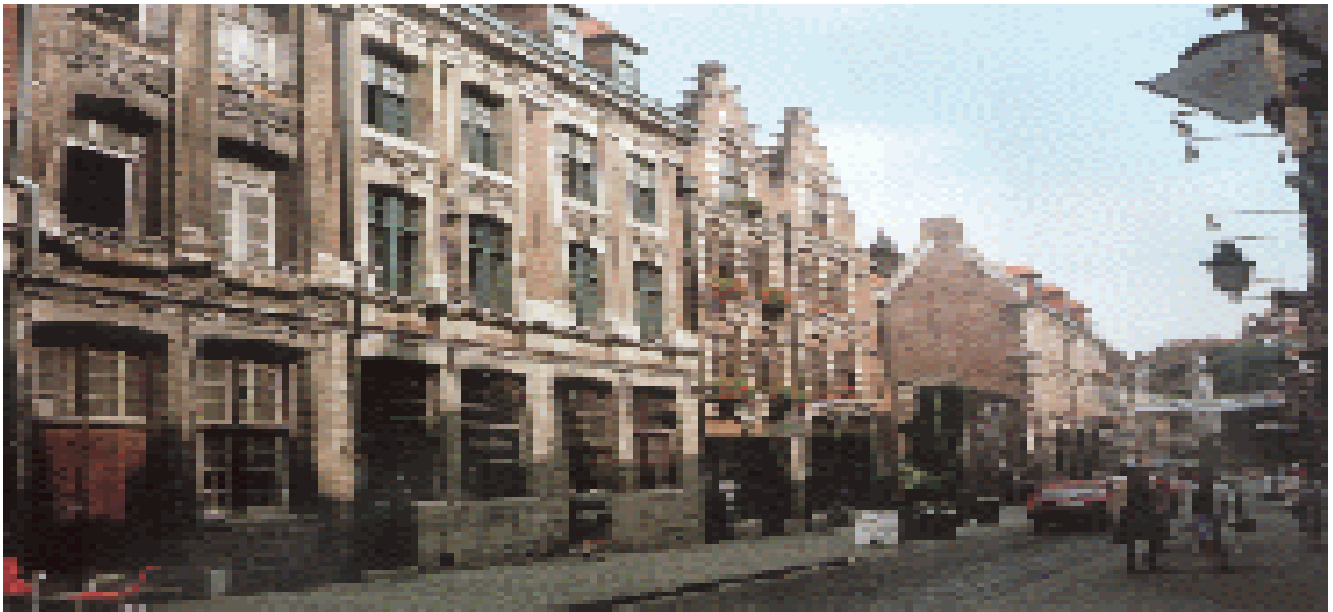
VECHIUL ORAS - LILLE