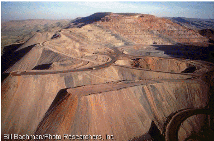
Platoul Kimberly: datorita acestuia, Australia a devenit cel mai mare furnizor de diamante din lume.

Economia: economia Australiei este situata intre primele 15 din lume, in timp ce PIB-ul sau este intre primele 20. Tara este foarte bogata in resurse naturale ca petrol, gaze, carbune, aur, cupru, uranium, minereuri de fier si bauxita. Carbunele si petrolul reprezinta 20% din castigurile prin exporturi, minereurile si mineralele circa 25%, iar aurul 8%. Agricultura are un procent semnificativ in PIB in comparatie cu alte tari dezvoltate, Australia roducand carne de vita, lana (cel mai mare producator din lume), grau si zahar. Industria reprezinta o treime din PIB.