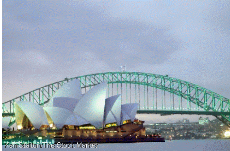
Sydney Opera House

Sydney Opera House este un bun exemplu al talentului arhitectural pe care australienii il au.