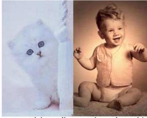
cap sau picioare disproporționat de mari în raport cu corpul