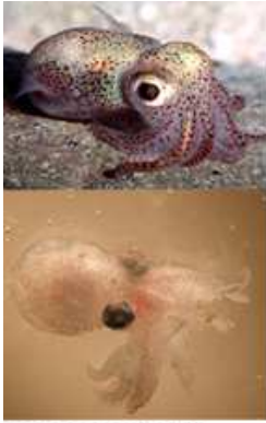
tentacule mici în raport cu corpul