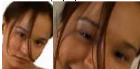
se cunoaște că poartă ochelari

Nici o altă specie de animale nu prezintă așa o varietate de forme, mărimi și culori între indivizi. Înfațișarea noastră este dată în principal de forma și dimensiunea oaselor unele în raport cu celelalte, forma și dimensiunea grupelor de mușchi unele în raport cu celelalte, dar și de detalii ca textura pielii, desimea părului, mărimea globului ocular, mărimea și colorația irisului, grosimea sprîncenelor, a buzelor și așa mai departe. Dacă privim corpul ca o extensie, un instrument al centrului nervos, atunci ar fi de bun-simț să credem și că dezvoltarea pe ansamblu a organismului e coordonată tot de sistemul nervos, iar ceea ce se vede la suprafață (înfațișarea) e în întregime produs al encefalului ; și poate că vorba de mironosiță “frumusețea vine din interior” conține mai mult adevăr decît s-ar crede... De exemplu, dacă un om poartă o perioadă îndelungată niște ochelari tip “fund de sticlă”, ai căror lentile îi fac ochii și irisul să pară mari, funcția fiziognomă a creierului va interveni și va repara problema adaptînd înfațișarea la accesoriu și micșorînd ochii și irisul, astfel încît omul va arăta bine cu ochelarii și stupid atunci cînd îi dă jos : ca dovadă că encefalul ajustează în mod continuu proporțiile volumetrice ale corpului.