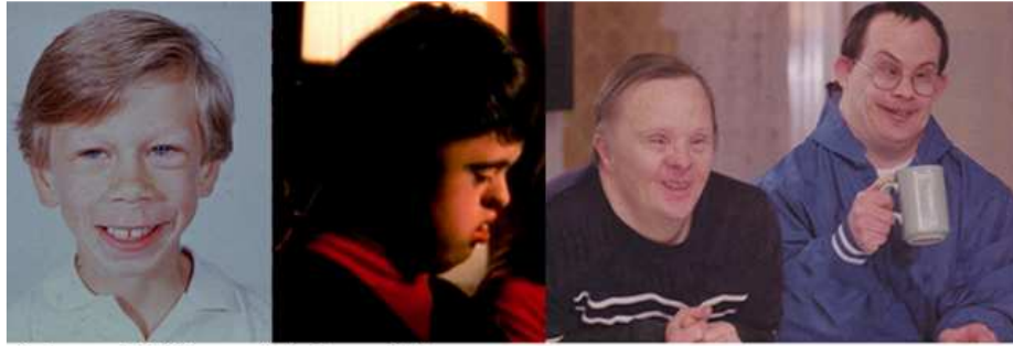
sindromul Williams și sindromul Down

Dar acest deformism fizic există nu numai la oligofreni și la cretini, ci, în măsuri mai mari sau mici, la toți oamenii – ne dăm seama mai greu de asta, din cauză că sîntem obișnuiți să-l vedem mereu la semeni și, din nefericire, nu prea se găsesc modele de perfecțiune printre noi, oameni cu totul desăvîrșiți. Practic în fizionomia oricui pot fi identificate defecte de estetică, mai accentuate ori discrete – gravitatea lor este în raport invers cu nivelul de inteligență și în raport direct cu imbecilitatea fiecăruia. Sîntem imperfecti, iar tocmai acest deformism fizic al omului îl valorifică arta caricaturii : caricatura nu face decît să exagereze, să batjocorească defectele din înfățișarea noastră ; perfecțiunea ireproșabilă, lipsa oricărui defect nu ar putea fi caricaturizată.